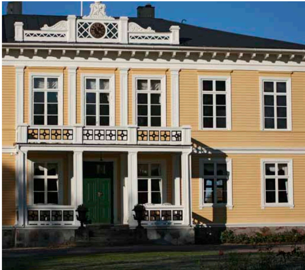
| Dörrblad, foder och panel i samma kulör | Öbruten guldockra på Bäckaskogs slott i Skåne | Fasaden på Hallansbergs herrgård är målad med ockragul

De två ljusare delarna av respektive färgprov visar en blandning av lika delar Standardkulör och Vit Titan-Zink samt en del Standardkulör och tre delar Vit Titan-Zink. Dessa kulörer blandar Du själv så här: S=Standardkulör och V= Vit Titan-Zink OBS! Denna blandningsnyckel gäller för samtliga kulörer