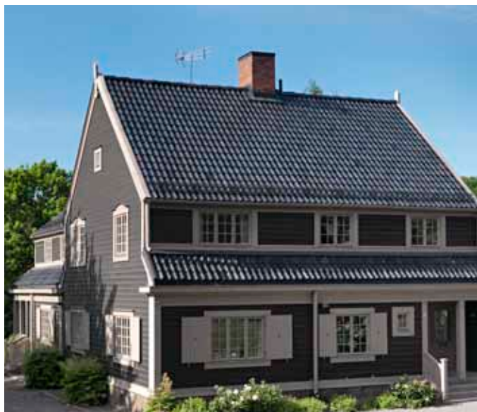
| Renoverat fönster i tyskt 1600-tals hus | Borggården, Stockholms slott | Svarta villorna i Stockholm byggdes 1914